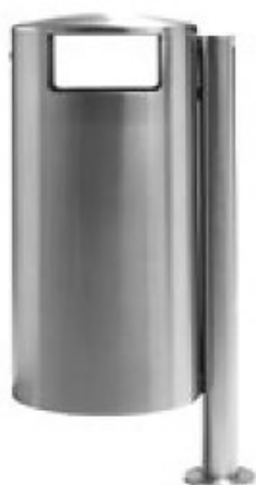
Art. 33002 A.D Art. 33002 B.D - Ascher

Grösse ohne Konsole: 610 x 350 mm (H x D)