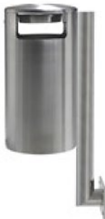
Art. 33001 A.F Art. 33001 B.F - Ascher