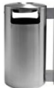
Art. 30001 A.E Art. 33001 B.E - Ascher