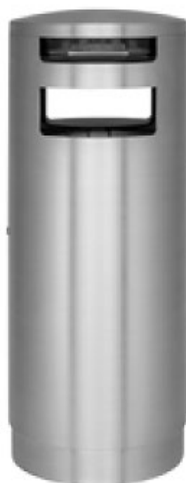
Art. 33002 F - Frontascher