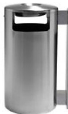
Art. 33002 A.E Art. 33002 B.E - Ascher