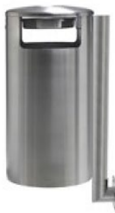
Art. 33002 A.F Art. 33002 B.F - Ascher