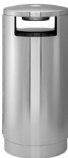
Art. 33004 A Art. 33004 C - Ascher