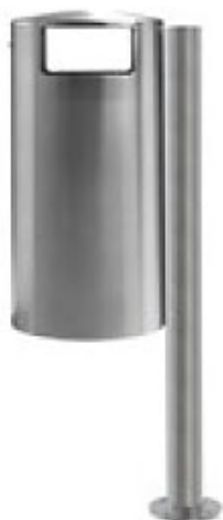
Art. 33001 A.D Art. 33001 B.D - Ascher